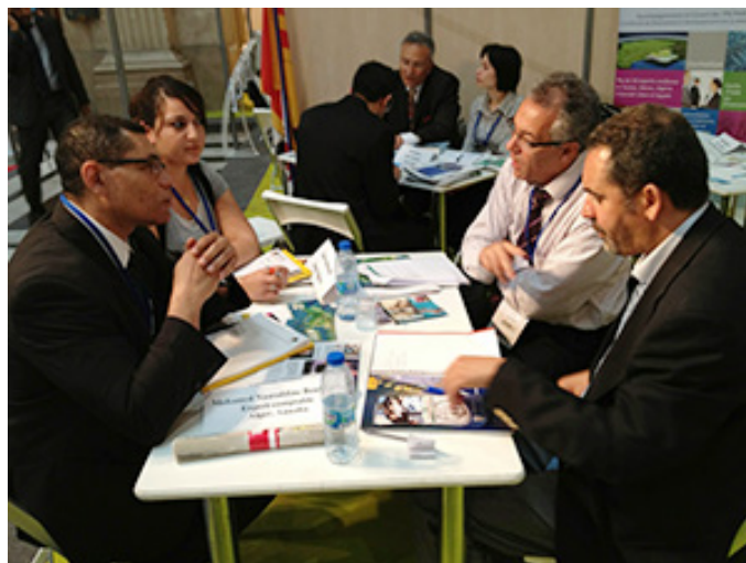
Légende photo : Six « experts confiance » participeront au Forum International Paca .

Pour en savoir plus : http://www.financesmediterranee.com/activites/plateforme-de-services-et-daccompagnement-des-pme/accompagnement-et-conseil-mediterranee